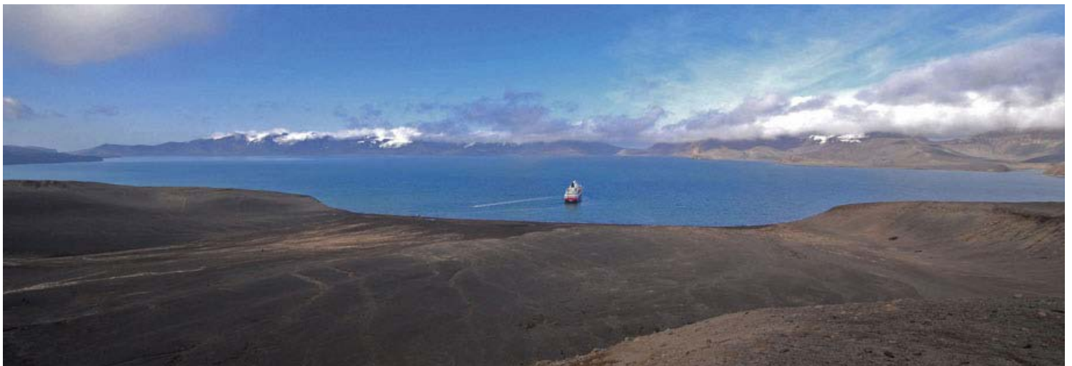
Playa de desembarco