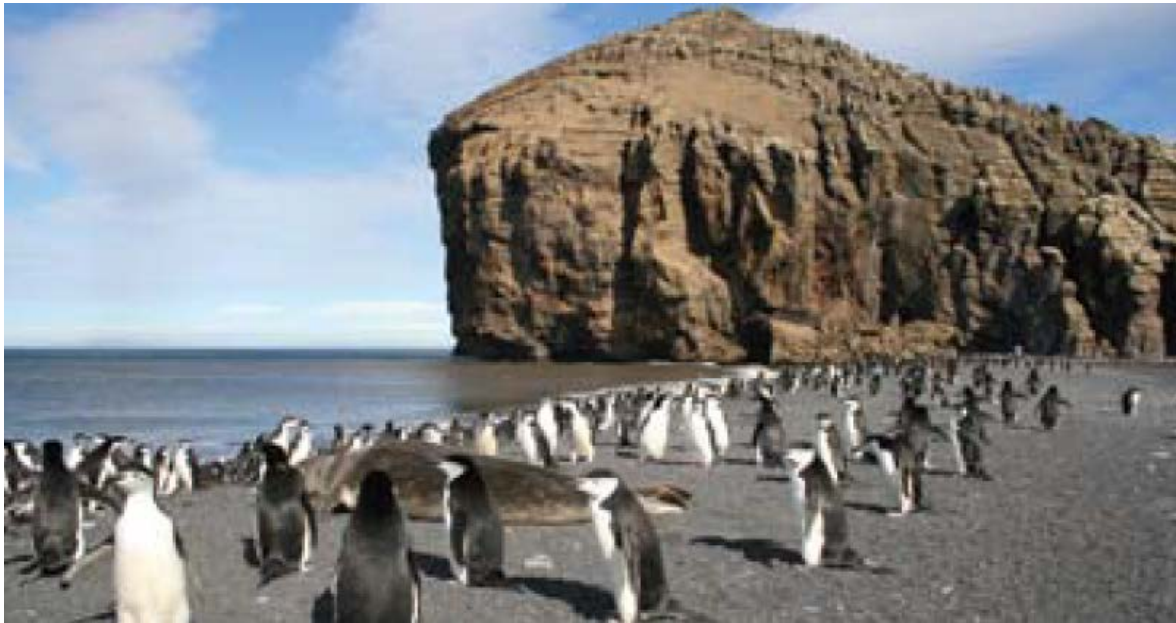
Playa de desembarco