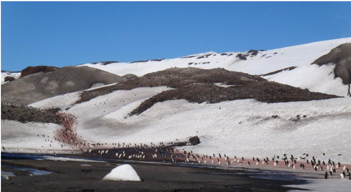
Camino de los pingüinos a lo largo del arroyo de deshielo

* Se entiende por buque una embarcación de más de 12 pasajeros.